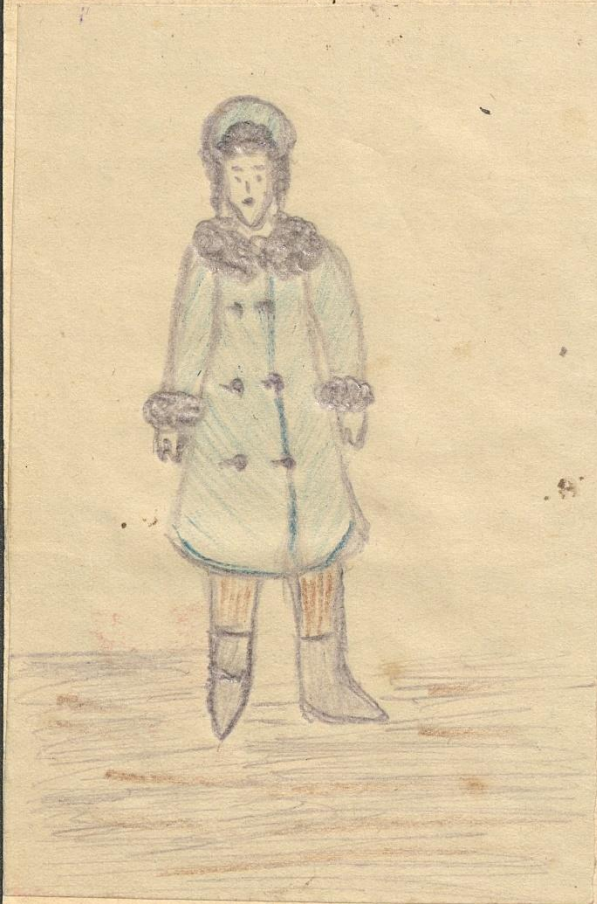
Воспитанница 131 го дет. дома 14 авг. 1942 года при выезде из Ленинграда. Варя Макарова. Вес: 33 кг.