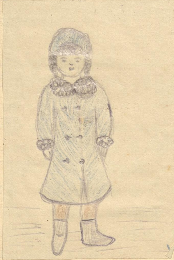
Варя Макарова 20 октября 1943г. Вес: 45 кг.