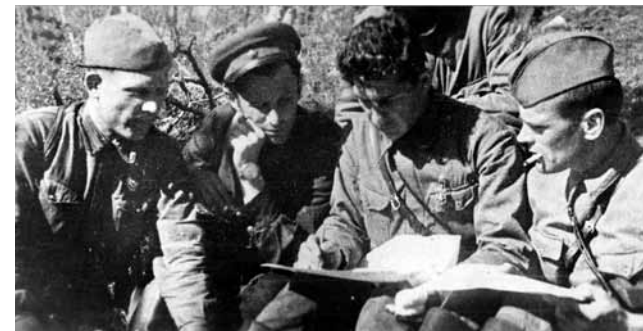
Командование партизанского отряда «Советский Мурман» за разработкой боевой операции. 1943 г. ГАМО. П-2393. Оп. 2. Д. 124. Л. 11.

Нашим двум отрядам** была поставлена задача: во второй половине декабря 1942 г. силами двух отрядов численностью около 120 чел. на лыжах пройти линию боевого охранения, зайти в глубокий тыл, в районы Сальмиярвинского аэродрома, произвести разведку его и совершить внезапный удар по зенитным батареям, охранявшим