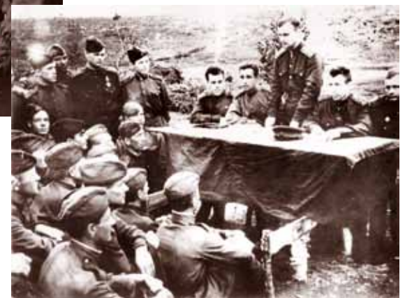
Партийное собрание в 10-й гвардейской стрелковой дивизии. 1941 г. ГАМО. Ф. Р-947. Оп. 5. Д. 912.