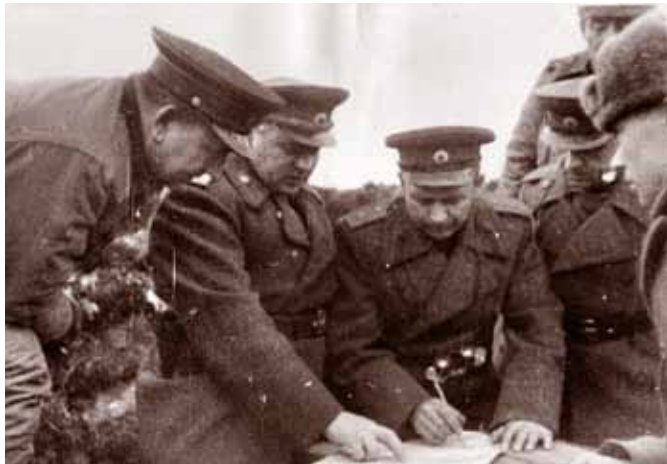
На наблюдательном пункте командующего 14-й армией. Слева направо: член Военсовета СФ вице-адмирал А. А. Николаев, командующий Карельским фронтом маршал К. А. Мерецков, командующий 14-й армией генерал-лейтенант В. И. Щербаков и член ВС Карельского фронта генерал-полковник Т. Ф. Штыков. Октябрь 1944 г.