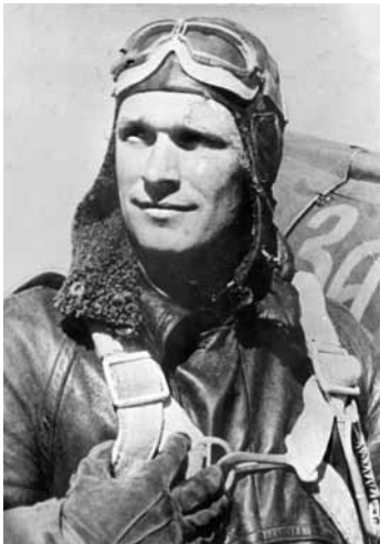
Сафонов Борис Феоктистович. Август 1941 г.

Борис Феоктистович неоднократно со своими питомцами вылетал на передний край войск противника, наносил бомбово-штурмовой удар по войскам и технике противника (так как у нас не хватало самолетов бомбардировщиков).