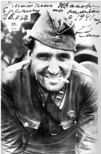
Симонов Константин Михайлович. 1941 г.

она и получила свое страшное название – «Долина смерти».