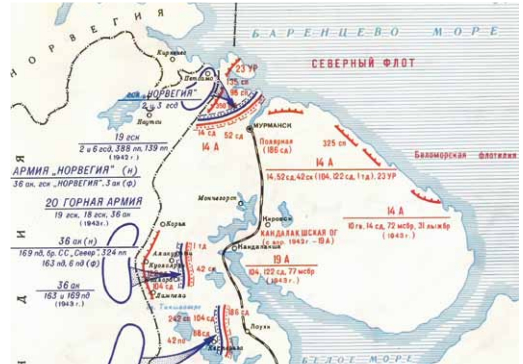
Карта боевых действий на Кольском полуострове. 1941–1944 гг. ГАМО. Ф. Р-1240. Оп. 1. Д. 14. Л. 60.