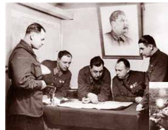
На КП 14-й армии Карельского фронта. Второй справа – М. И. Старостин, первый секретарь Мурманского ОК ВКП(б), член Военных советов Северного флота и 14-й армии. 1942 г. ГАМО. Ф. Р-1537.